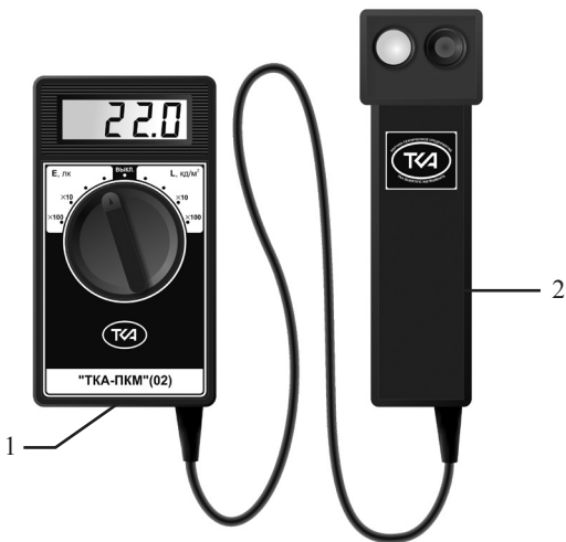
Рис.1. Внешний вид прибора “TKA-PKM”(02)